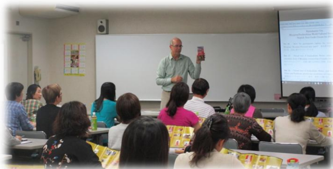
熱心にリック先生の講義を聴く生徒のみなさん

4月に募集した同講座が好評だった、「宮島ボランティア通訳ガイド養成講座」。今回も秋の第2弾として募集したところ、すぐに定員30名の席が埋まりました。受講者は10月から月に一度、5回分の講座を学びます。今回はその様子を少しだけ報告します。