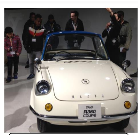
昨年のマツダ工場見学のようす

土曜通訳ボランティアでは、月に1回、「楽しく学ぶ英会話」をオープンしています。中学校レベルの簡単な英語を使って、日常会話のトレーニングをしています。今後はネイティブの講師を招いてのレッスンも企画！大人の方はもちろん、中学生や高校生の参加を待っています。 日時：毎月第3土曜日 10時～12時 場所：廿日市市中央市民センター