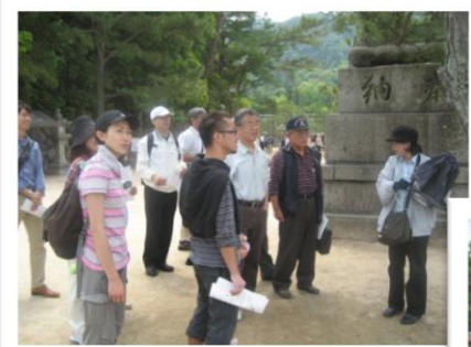
宮島ガイド研修のようす 宮島に精通している専門の方に案内してもらいました

土曜通訳ボランティアは、2003年から平日に働く人のための英会話部会としてスタートしました。廿日市市内だけではなく、広島県内の観光地、名所、旧跡を巡る現地ガイド研修を不定期に行っています。昨年は、マツダの工場見学を実施しました。週末や祭日を中心に、気軽に参加できる活動を行っています。