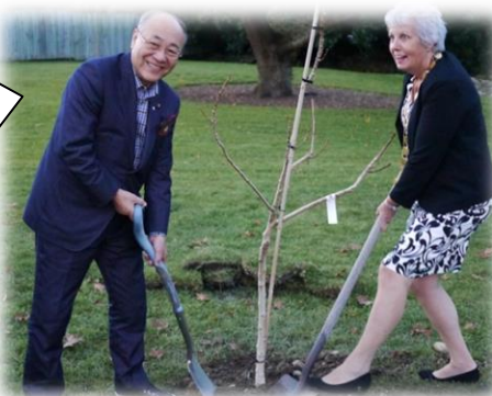
眞野市長とリン市長 記念植樹のようす