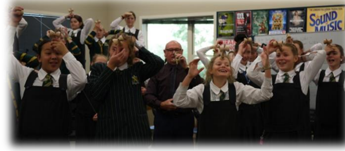
セントマシューズ女子校でけん玉交流!