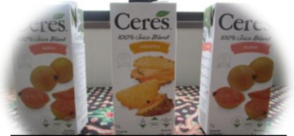
心地よい汗をかいた後は冷たいトロピカルジュースでリラックス

「“カイマナヒラ” 楽しく踊れました。先生の指導も良く、踊れました。ハワイ文化や歴史の話を聞いて良かったです」 (参加者コメント)