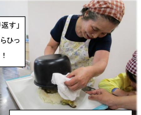
せーの！マックルーバー！