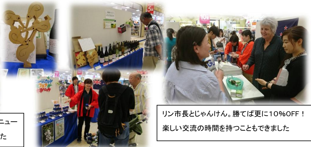
リン市長とじゃんけん。勝てば更に10%OFF！ 楽しい交流の時間を持つこともできました