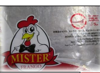
ハラルマークのついた 鶏肉を使用しました