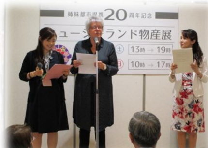
初日はオープニングセレモニーが開かれ、ニュージーランド・マスタートン市長も出席されました

5月19・20日に、ゆめタウン廿日市で、ニュージーランド物産展を、廿日市市国際交流協会が市から受託し、開催しました。ニュージーランドの名産品「マヌカハニー」やワイン、チョコレートなど、日本ではなかなか手に入らない、珍しい品物が店頭と並べられました。通りがかったお客さんも、思わず立ち寄って品物を手に取り、興味深そうに質問をするなど、なかなかの賑わいを見せました。