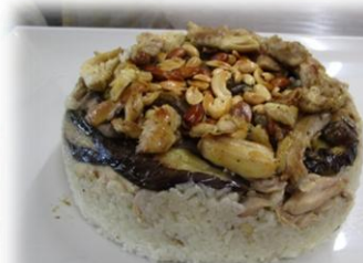
マックルーバーとはアラビア語で「ひっくり返す」という意味。その名のとおり、「おひつ」からひっくり返して、ケーキのようにデコレーション！