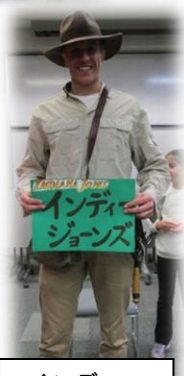
インディ・ジョーンズ