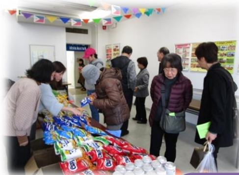
フィリピンの商品を販売