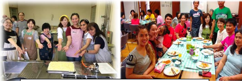
2016年6月料理交流会 フィリピン料理を教わりました

日本語が理解できないため、郵便物や学校からのお知らせ、支払いや提出の期限を理解できないという、生活の中での細かな問題が発生していました。これを問題視し、廿日市市国際交流協会では、平成26年秋から月一回の「宮島日本語教室」をスタートしました。教室では、日本人ボランティアと共に、学習者一人ひとりのレベルを確認しながら学習を進めています。日本語の学習だけでなく、ゴミの分別・出し方など、生活に密着した疑問点を導き出し、個々の質問に答えたりなど、生活のサポートもしてきました。