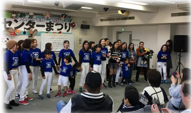
ステージ会場ではフィリピンファミリーがダンスを披露して盛り上げました！