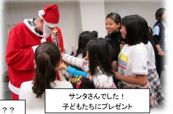
サンタさんでした！ 子どもたちにプレゼント