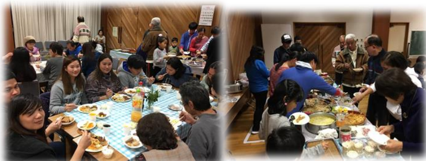
2018年12月クリスマス交流会 地元住民とゲームを楽しみました

廿日市市国際交流協会では、これからも地域の方々との接点を増やせるように交流の場を設け、お互いが文化や生活習慣の違いを認め合いながら生活できるようサポートしていきたいと思っています。