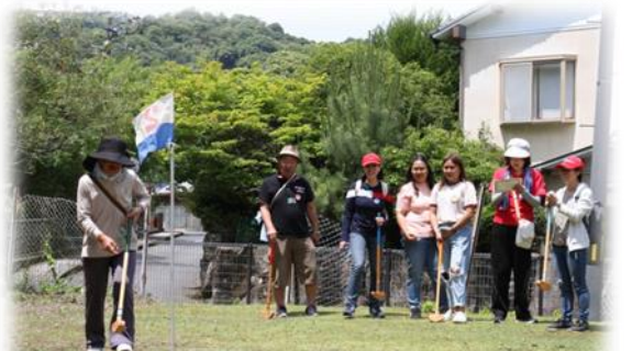
2018年6月グラウンドゴルフ大会 スポーツを通して交流を楽しみました

学習だけでなく、毎年12月にはクリスマス会を開き、自慢の料理を持ち寄り、日本の歌を歌ったり、ゲームをしたり、楽しく交流しています。また、島民との交流の橋渡しとして、宮島市民センターと協力し、料理会や、グラウンドゴルフ大会を開催しました。このような国際交流をすることで、フィリピン市民も地域の中に溶け込み、言葉や文化は違っても、共に宮島に住む者同士で仲良く生活していけるよう、お手伝いしています。