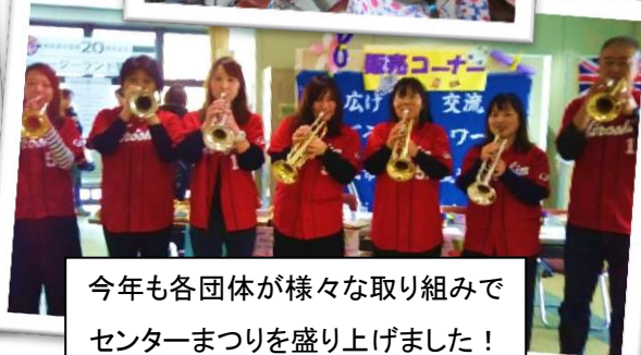
今年も各団体が様々な取り組みでセンターまつりを盛り上げました！