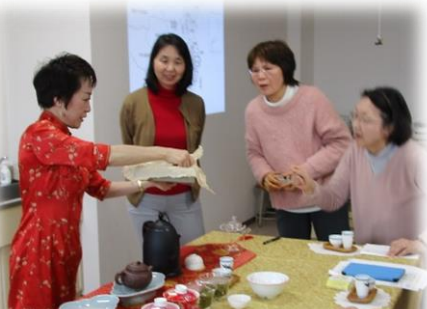
珍しい茶葉にみなさん興味深々！