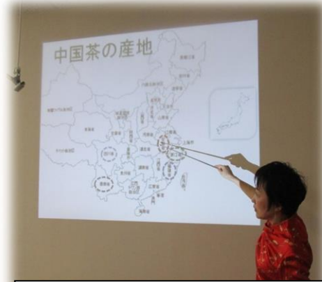
中国のお茶の歴史を、画像を使って丁寧に説明していただきました

初めにスクリーンを使ってお茶の歴史の講座。日本では中国茶といえば、烏龍茶、ジャスミン茶、プーアル茶くらいですが、実は1,000種類以上もあり、産地によって個性豊か。また、発酵度によって、緑茶になったり、違う茶になったりと、製造法でも分けられるなど、トリビアのような濃い内容でした。中国茶の奥深い歴史、庶民の間で重要な財産でもあった茶葉とのかかわりあいを勉強することができました。