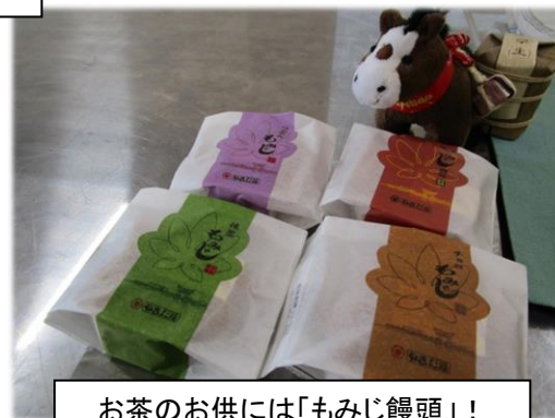
お茶のお供には「もみじ饅頭」！