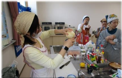
ココナツのジュースを試飲しました。ほんのり優しい甘さですね