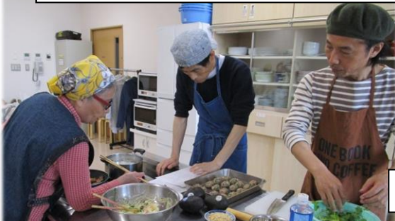
男性の参加者も積極的にお料理します。 男子自ら進んで厨房に入るべし！