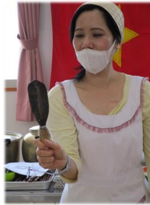
珍しいベトナムの調理器具を紹介

【今回のメニュー】 青パイヤの和え物 ブンチャー(ベトナム風つけ麺) ケム・ポー(アボカドアイス)