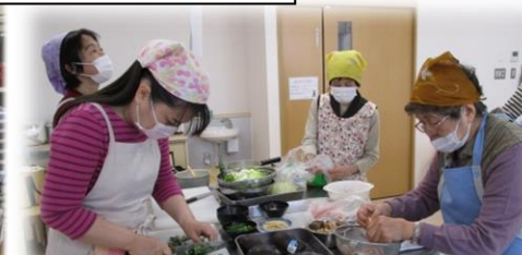
初対面同士でも、調理しながらの交流は、だんだんとチームワークが生まれました