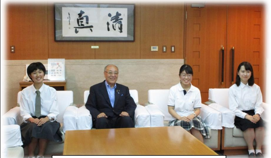
市長表敬訪問の様子。行ってらっしゃい！

このプログラムは、私の英語のスキルアップと国際性を養うための良いチャンスだと思います。廿日市の若者が世界に飛び立つための足がかりになるよう、精一杯頑張ってきます。