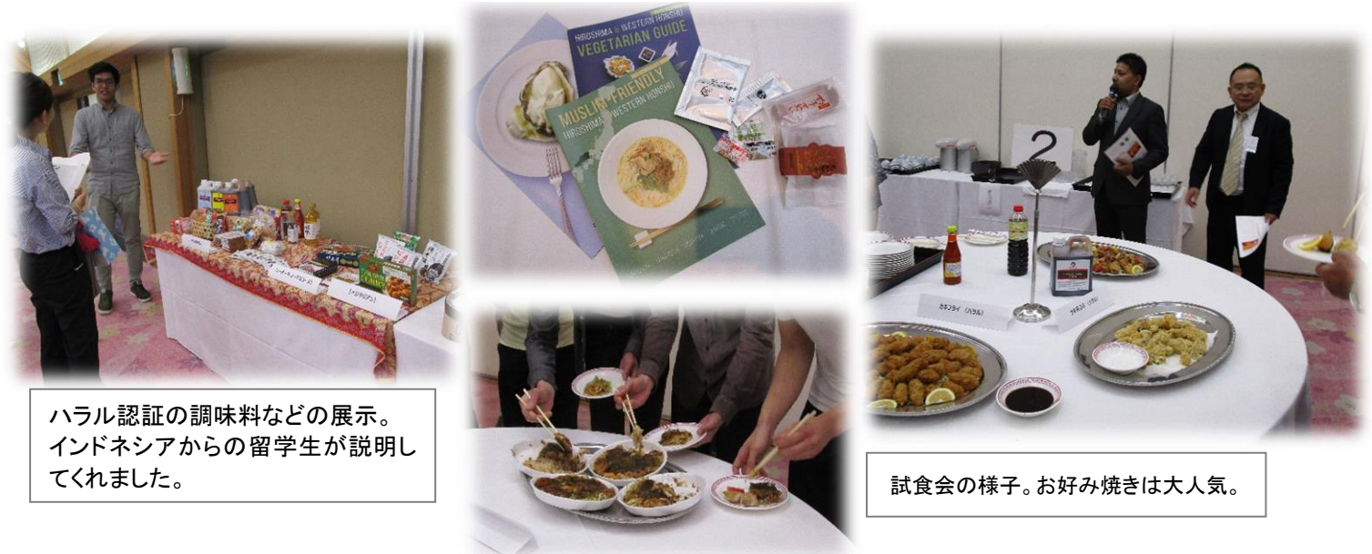
ハラル認証の調味料などの展示。インドネシアからの留学生が説明してくれました。

6月26日(水)宮島ホテルまことにて、廿日市市主催、国際交流協会共催でムスリム・ベジタリアン対応の基礎知識を学ぶセミナーが行われました。参加者は飲食店や宿泊施設の方がほとんどでしたが、国際交流協会の会員の方たちもたくさん参加され、今後のホームステイ受入れや交流の参考にしようと熱心に学んでいらっしゃいました。セミナー後の試食会ではハラル認証の食材、調味料を使ったお好み焼き、カレー、カキフライなどが並び、料理を担当したシェフの説明を聞きながら試食しました。調理法やレシピの紹介もあり、知識さえあれば難しく考えずにおもてなしできるのだと実感しました。