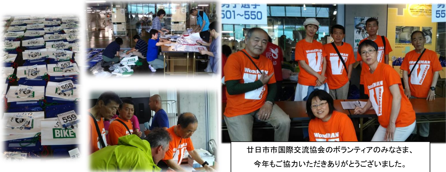
廿日市市国際交流協会のボランティアのみなさま、今年もご協力いただきありがとうございました。

「はつかいち縦断みやじま国際パワートライアスロン大会2019」が6月16日(日)に開催されました。この大会は協会の団体会員でもあるはつかいち観光協会が開催する事業で、今年で12回目。廿日市市国際交流協会では、毎年「おもてなし部会」として、協会会員のみなさまにボランティアで協力していただいています。今年も袋詰めや、外国人選手への通訳、選手受付をお手伝いしました。