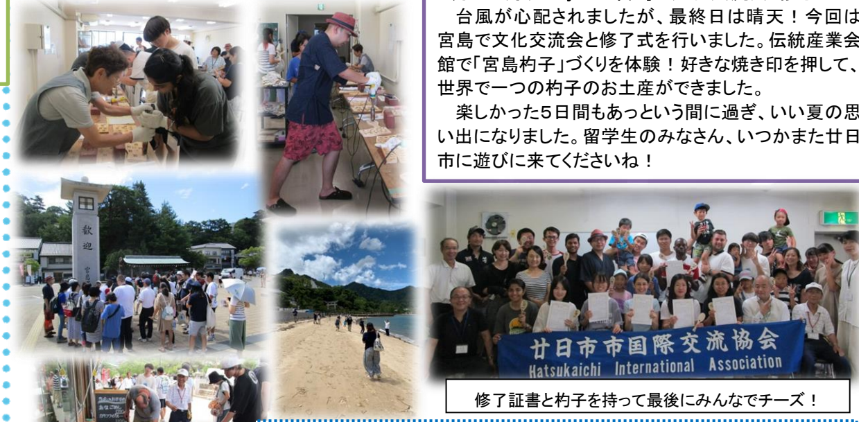
修了証書と杓子を持って最後にみんなでチーズ!

楽しかった5日間もあっという間に過ぎ、いい夏の思い出になりました。留学生のみなさん、いつかまた廿日市に遊びに来てくださいね!