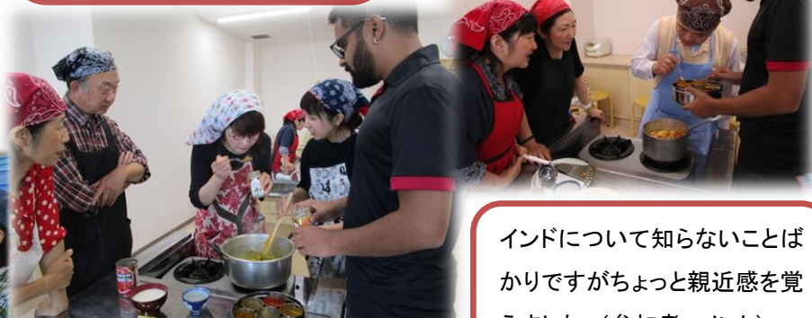
スパイスの香りを体験。いい香り!

スパイスを使ったカレーに興味があったので、これを機会に自分なりのカレーを作ってみようと思います (参加者コメント)