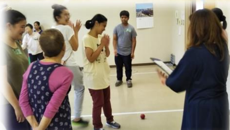
ペタンクで大盛り上がり！