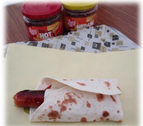
チーズが入ったスパイシーチリドッグ 辛さ控えめのサルサソースで大人気でした