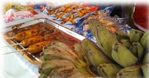
揚げバナナはあっというまに売り切れ！

インドの子どもの達の生活と教育を支援。直接インドへ行き、紅茶などを買い付けてイベントで販売、寄付を集めています。