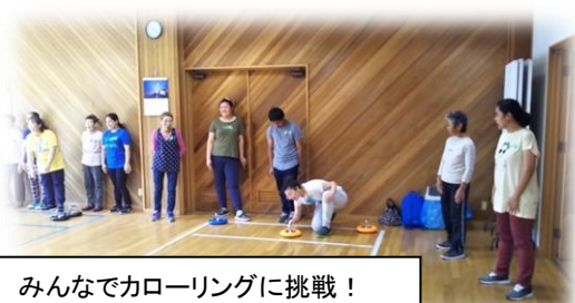
みんなでカローリングに挑戦！