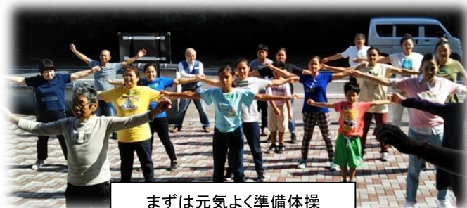
まずは元気よく準備体操