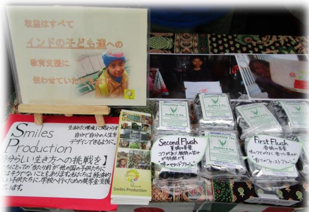
インドの香り良い紅茶と 100%オーガニック石けんも販売。売上の一部が寄付となります。

お陰様であつという間に、チリドッグは完売！今回もボランティアのみなさまにご協力いただいて、無事、成功することができました。みなさんありがとうございました！