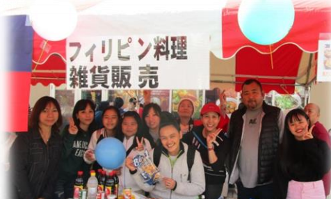
会場を盛り上げたフィリピン人のみなさん