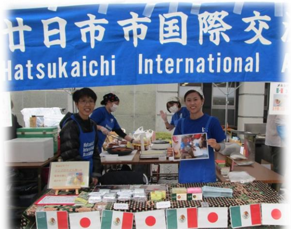
お手伝いしていただいたボランティアさんたち