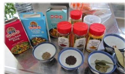
たくさんの種類のスパイスを使いました