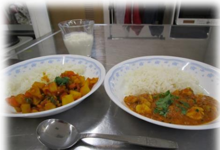
チキンとベジタブル2種類のカレー。ラッシーも作りました

スパイスを使ったカレーに興味があったので、これを機会に自分なりのカレーを作ってみようと思います (参加者コメント)