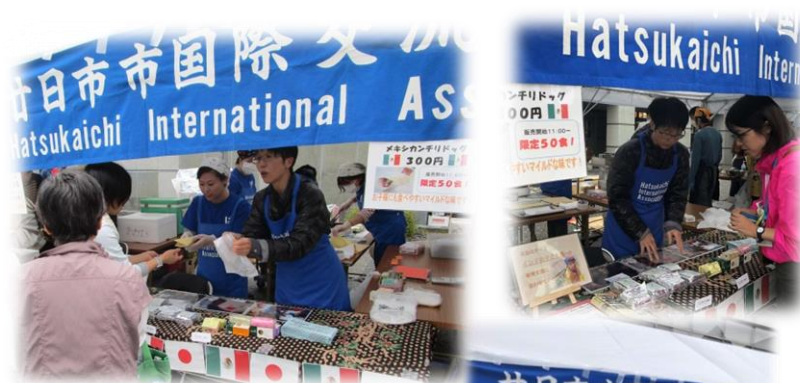
たくさんの方がブースに訪れ、高校生によるDJのインタビューも受けました