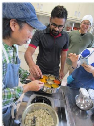
チェタンさん直々にスパイスを調合