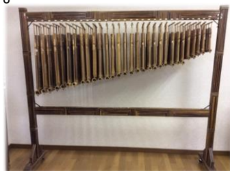
メロディーアंकロン→

この楽器を演奏していたのは『アルンバ広島』と言うグループです。グループメンバーは広島市民4人、廿日市市民6人から構成されています。