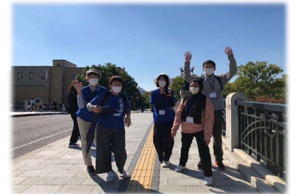
ボランティアと留学生がだいぶ打ち解けてきました♪