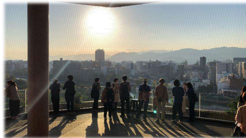
美しいサンセットに感動！