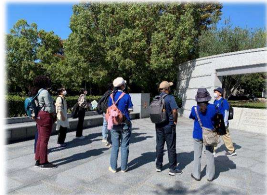
碑巡りでボランティアの話を熱心に聞く留学生たち