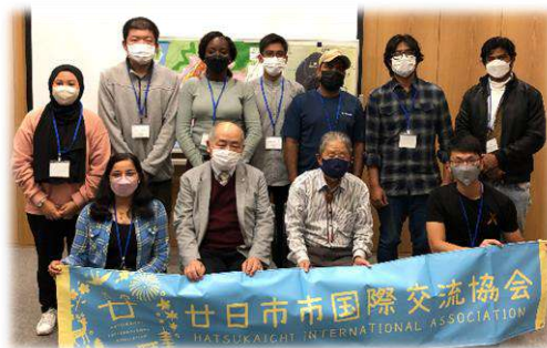
豊永さん、太泰実行委員長と一緒に。