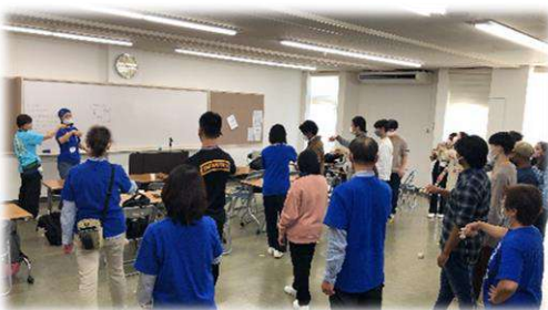
けん玉体験！これからだんだんエキサイトしていきます！