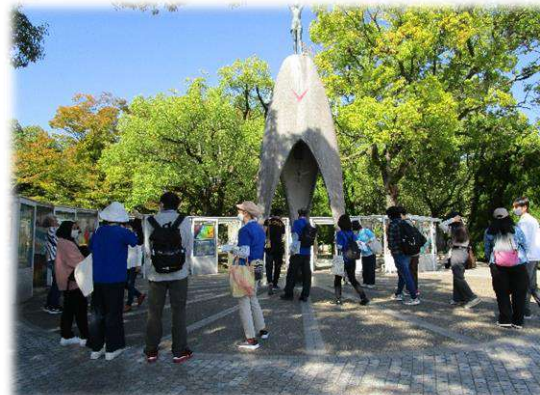
ボランティアの方々の準備が細やかで、留学生からの質問にも英語で答えられていました