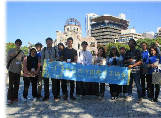
原爆ドーム対岸で記念写真！