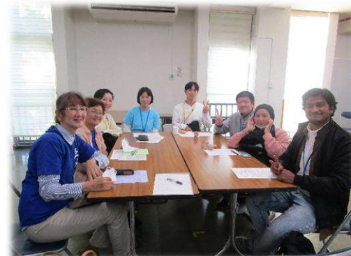
3グループに分かれての討論会と発表！お互いの意見を交わし合う貴重な時間となりました。