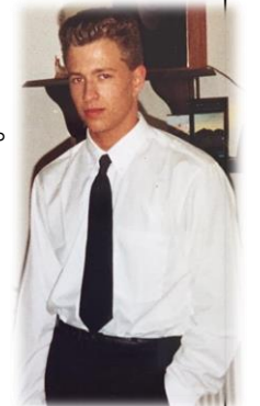
更にイケメンになったレイさん

このあともレイさんのプライベートをたくさんお聞きしました♪つづきは8月号で(^)/