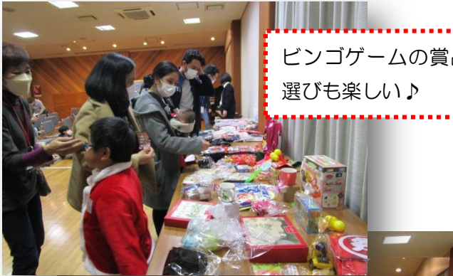
ビンゴゲームの賞品 選びも楽しい♪

12月17日土曜日に、宮島・杉之浦地区在住者とフィリピンコミュニティとのクリスマス交流会が開催されました。みなさんにご寄付いただいたお品は、ビンゴゲームの商品にさせていただきました。また、ご寄付いただいた洋服は、希望者にお持ち帰りいただきました。（完売?でした!）ご寄付へのご協力ありがとうございました。