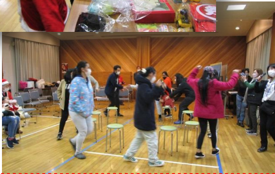
寒い日でしたが、椅子取りゲームは熱かった♪