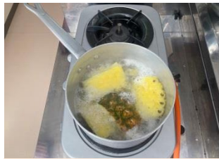
米とパイナップルをゆでます

「くらしで初めて知ったどローカルごはん」は Amazon より 1100円で販売中です！