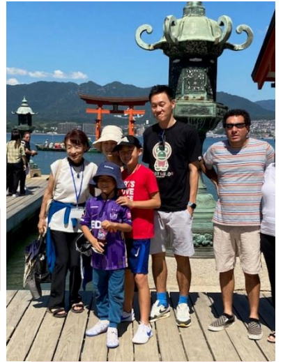
火焼前(ひたさき)灯籠前の 撮影スポットで。