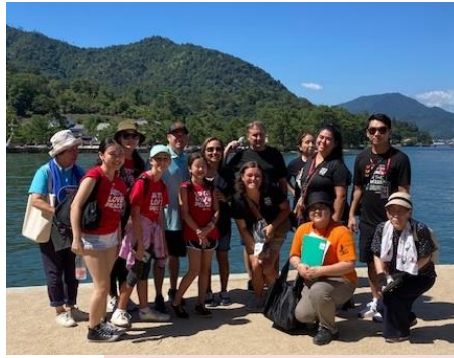
大鳥居をバックに記念撮影。