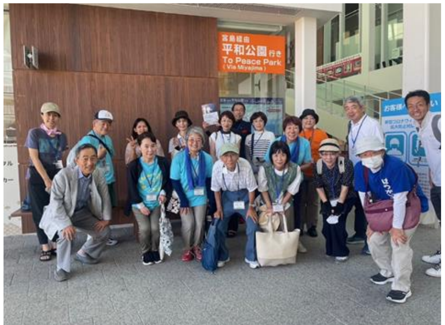
宮島ロフェリー乗り場前に集合した宮島ガイド・サポートボランティアのみなさん、お客様をお迎えする前のひととき、新しい出会いに胸膨らませて顔が輝いています。