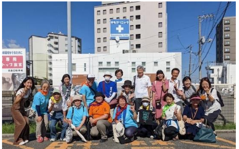
市営観光バス駐車場でのお見送り。HIGAのガイドさんも一緒に記念撮影。