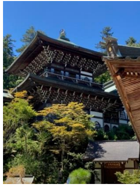
摩尼殿まで登ったグループも！