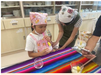
スパイスの効いた自然な甘さで美味しい～♪