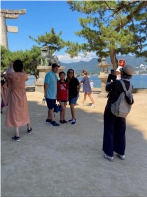
石鳥居の前で。 写真撮影を 頼まれて、 ハイチーズ！