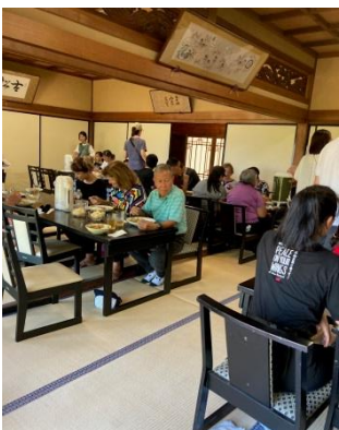
大聖院の客殿で、昼食メニ ューはカレーライスでした。