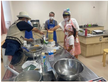
ゆでた米とパイナップルの端をジューサーでまぜます