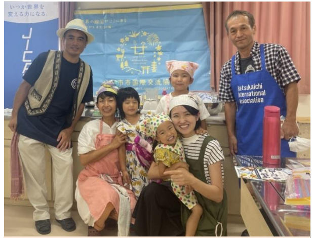
最後は、みんなで記念写真を撮りました♪

「くらしで初めて知ったどローカルごはん」は Amazon より 1100円で販売中です！