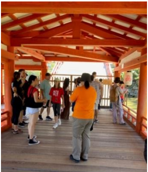
厳島神社はガイドポイント がいっぱい。がんばりまし た。