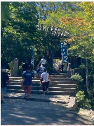
今から大聖院に上がりま す。