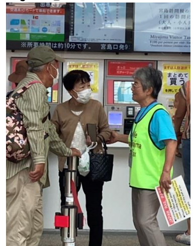
もちろん日本人観光客にも案内します♪

11月からも継続の予定ですので、ご希望の方は廿日市市国際交流協会までご連絡くださいませ。