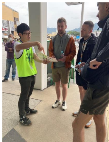
資料を使っでの説明を熱心に聞いてくれる観光客。