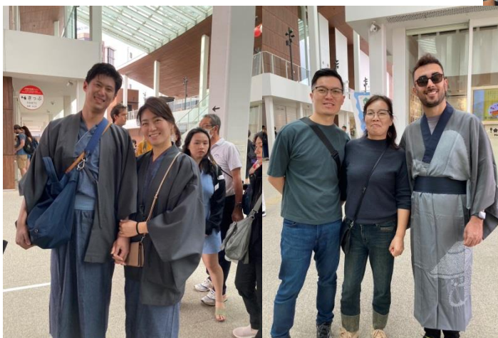
着物で来てくれた観光客の2グループ。日本文化へのリスペクトを感じます！宮島を楽しんでください！