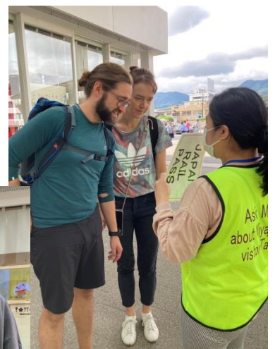
ボランティアの丁寧な対応に、観光客もにっこり！笑顔が笑顔を呼びました♪