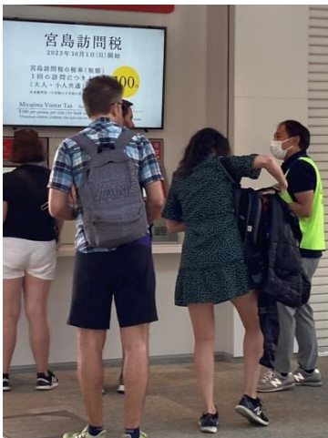
「訪問税」の券売機の前で説明。

テレビでご覧になられた方も多いと思いますが、TV撮影クルーもいて初日の宮島口は大混雑でした！