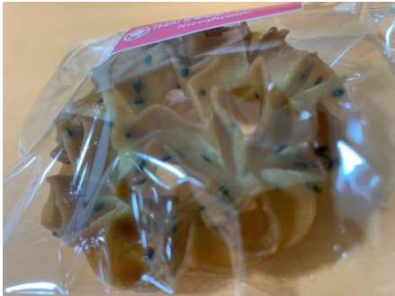
すぐに完売した「花びらクッキー」100 円。ココナッツの香りがする香ばしいクッキーです。軽くてとても美味しい♪お花の形が映えます♪