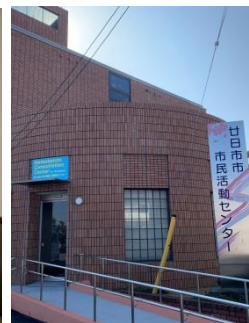
駐車場側からの入り口