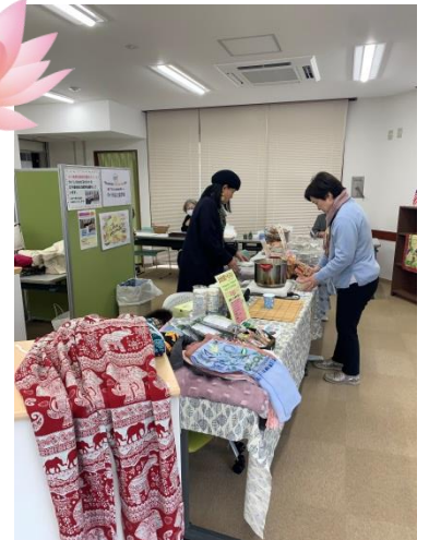
自然な花や動物が型染めされたコットンのパンツや、刺繍が施されたスカーフなどもほぼ完売しました♪