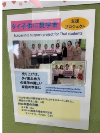
支援の活動内容は自作のポップで紹介されていました。