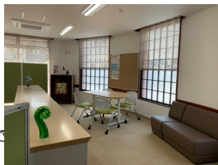
入って左にカウンター、右にソファ

ソファやゆっくり座って相談できるテーブルもありますのでみなさまのお越しをお待ちしています。