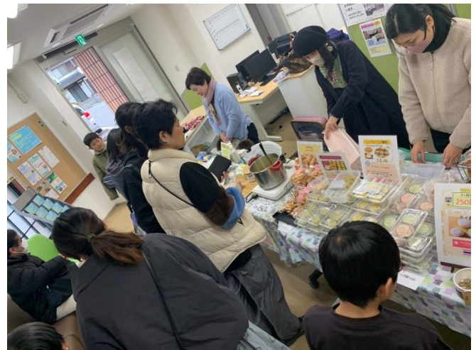
多くの方々にご購入いただけて完売！「おつりは寄付して！」って言うくださったり、寄付金ボックスに寄付してくださる方々も！！みなさまに感謝の一日でした♪

ワールドクイズ⑦の答え：(①) 北米はアメリカ合衆国、カナダ、メキシコ、中央アメリカおよびカリブ海の諸国を含む。中米はグアテマラ、ベリーズ、ホンジュラス、エルサルバドル、ニカラグア、コスタリカ、パナマの 7 개국。南米はブラジル、アルゼンチン、ベネズエラ、ウルグアイ、スリナム、パラグアイ、ペルー、コロンビア、エクアドル、チリ、ボリビア、ガイアナの 12 개국。