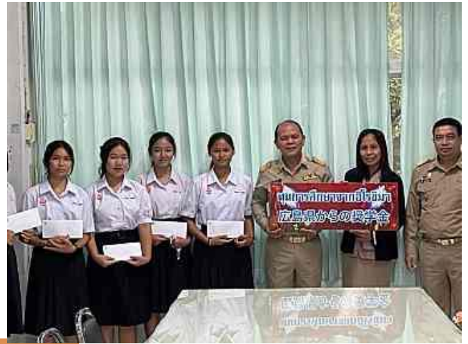
タイ東北地方の高校を訪問した時に、校長先生と副校長先生と一緒に撮った写真です。