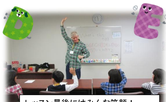
レッスン最後にはみんな笑顔！ アーロン先生がやさしくリードします