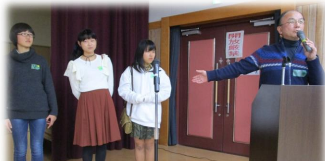
突然の呼び出しに目が泳ぐみなさん(笑)

今年もまた、年に1度の会員交流会。今年は裾野を広げる意味で「ウィンターパーティー」と名付け、会員外の方にもたくさん来てもらえるよう呼び掛けました。おかげさまで外国人の方を含む、80名以上の方が遊びに来てくださいました。今月号ではパーティーの様子をレポートします。