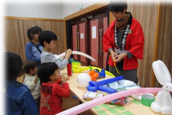
バルーンアートコーナーも大人気でした

仮装ゲームでは、各チームメイトと当日モデルさん、初めて出会う人もいて、どうなるか分からないハラハラ感もあるなか、スピーディーな仕上がりに参加者(プレーヤー)も見ていた人(ギャラリー)もおおいに盛り上がったと思います。仮装後のPPAPダンスは今年ならではの思い出になったのではないのでしょうか。来年も楽しみです。(ボランティア K. Hさん)