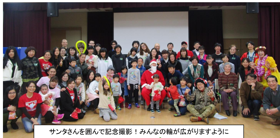
サンタさんを囲んで記念撮影！みんなの輪が広がりますように

色とりどりの明るい衣装と、 すばらしいダンスで会場をど んどん温めてくれました！