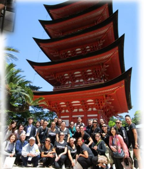
ハワイアンコンサートの出演者