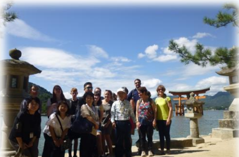
安芸高田市 & NZ姉妹都市交流