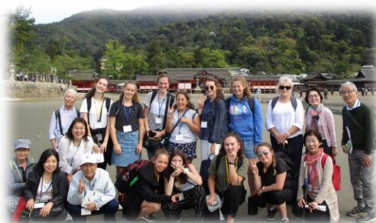
セントマシューズ女子校廿日市市訪問2018