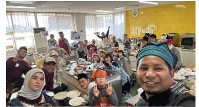
調理中に集合写真を撮りました