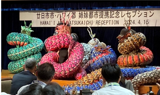
大迫力の八岐大蛇に見入っておられました