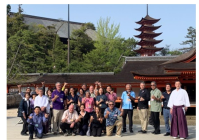
笑顔满面ハワイ郡のみなさま