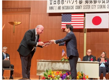
調印式は文化ホールウッドワン さくらびあ小ホールで行われました

4月15日(月)ハワイ郡との姉妹都市提携を結んだ後、安芸グランドホテルに場所を変え、レセプションが行われました。みなさま神楽のアトラクションやお食事を楽しまれる中、通訳ボランティアは各テーブルや座席を離れたところでも説明をして、明るいハワイの方々と楽しい時間を過ごし賑やかな会となりました。