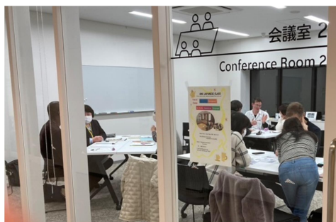
3つまたは4つのテーブルに分かれて、ほぼ1対1で学習しています！

今年3月に始まった大野教室です。毎週金曜日19:00から、まるくる大野2階会議室2で開催しています。アイデアを出し合い、素敵な教室名が決まりました。日本語を学びたい方、またボランティア希望の方はぜひご参加下さい。