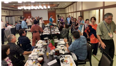
みんなで踊って大盛り上がり！