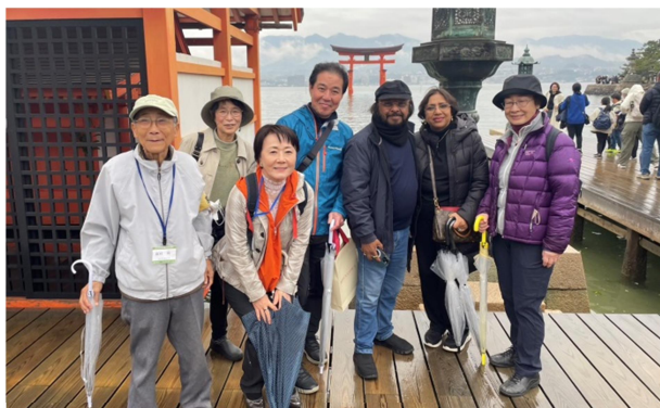
厳島神社でハイチーズ！