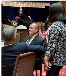
ボランティアは、あちこちで皆様の間に入って通訳されていました