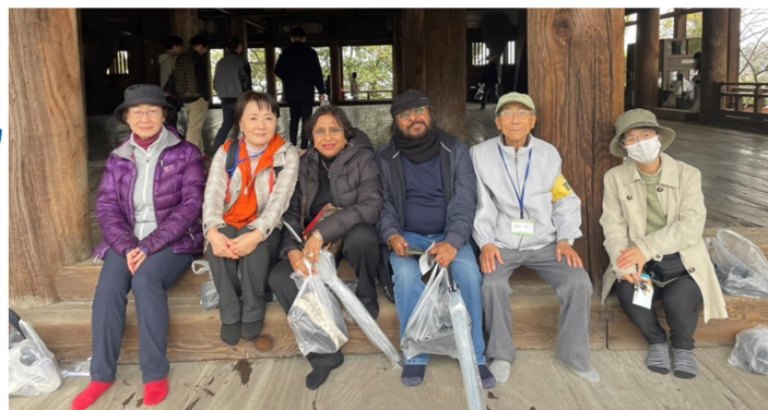
千畳閣にて一休み♪